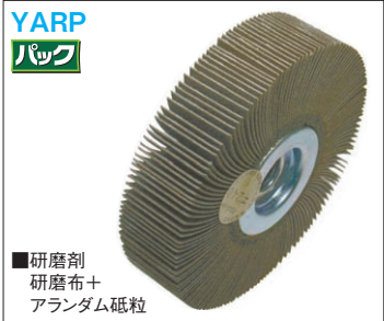
■ 研磨剤 研磨布十 アランダム砥粒