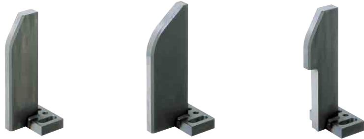
ガイド奥行き指定 NGW