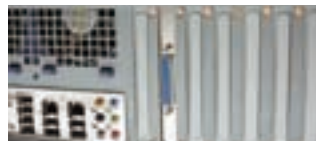
PCIブラケット接続イメージ