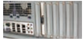
PCIブラケット接続イメージ