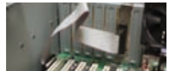
筐体内部コネクタ接続イメージ