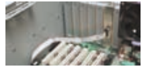
筐体内部コネクタ接続イメージ