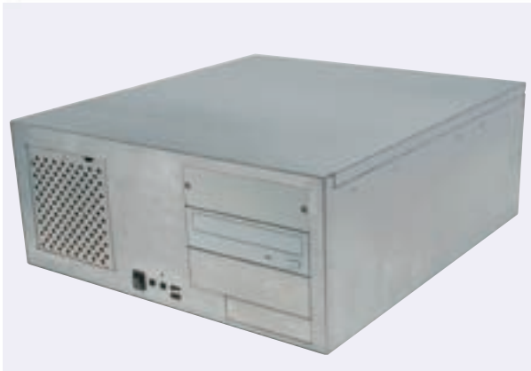
※外観および仕様は、予告なく変更することがあります。

無料 送料 9023 ATX 電源 PCI Express PCI Delivery 納期