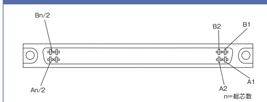
FCNメスコネクタ コンタクト配列図