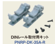
DINレール取付用キット PNRP-DK-35A-R