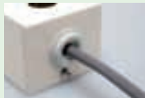
③外側からケーブルを差込む。