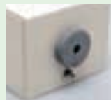
②ボックスに差し込む