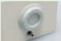
①エラストマー膜に小さな穴を開ける。 ②部材の外側からケーブルグラッドを差込む。