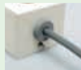
③ケーブルを差し込む