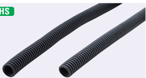
CTUBシリーズ KCNシリーズ