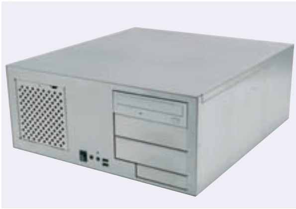
※外観および仕様は、予告なく変更することがあります。

無料貸出 9023 ATX電源 PCI Express PCI Delivery納期