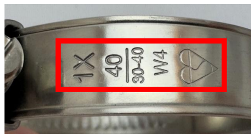
ホース外径締め付け範囲＋メーカー規格刻印